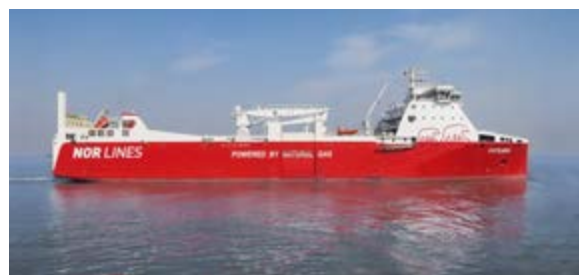
MS Kvitbjørn (CL)