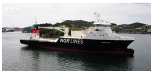
MS Nordkinn (PL)