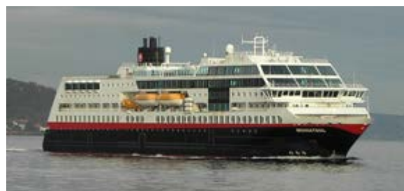
MS Midnatsol (HR)